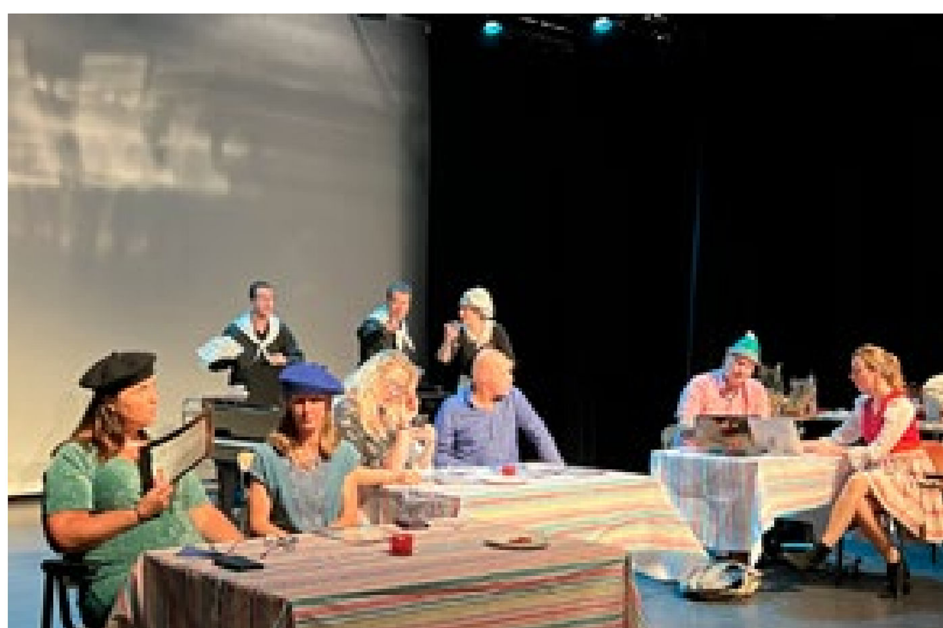
't Speeltooneel met de tweede act van de avond: in een restaurant gaat van alles mis vanwege de 'dreiging' van een Michelinster-recensent.