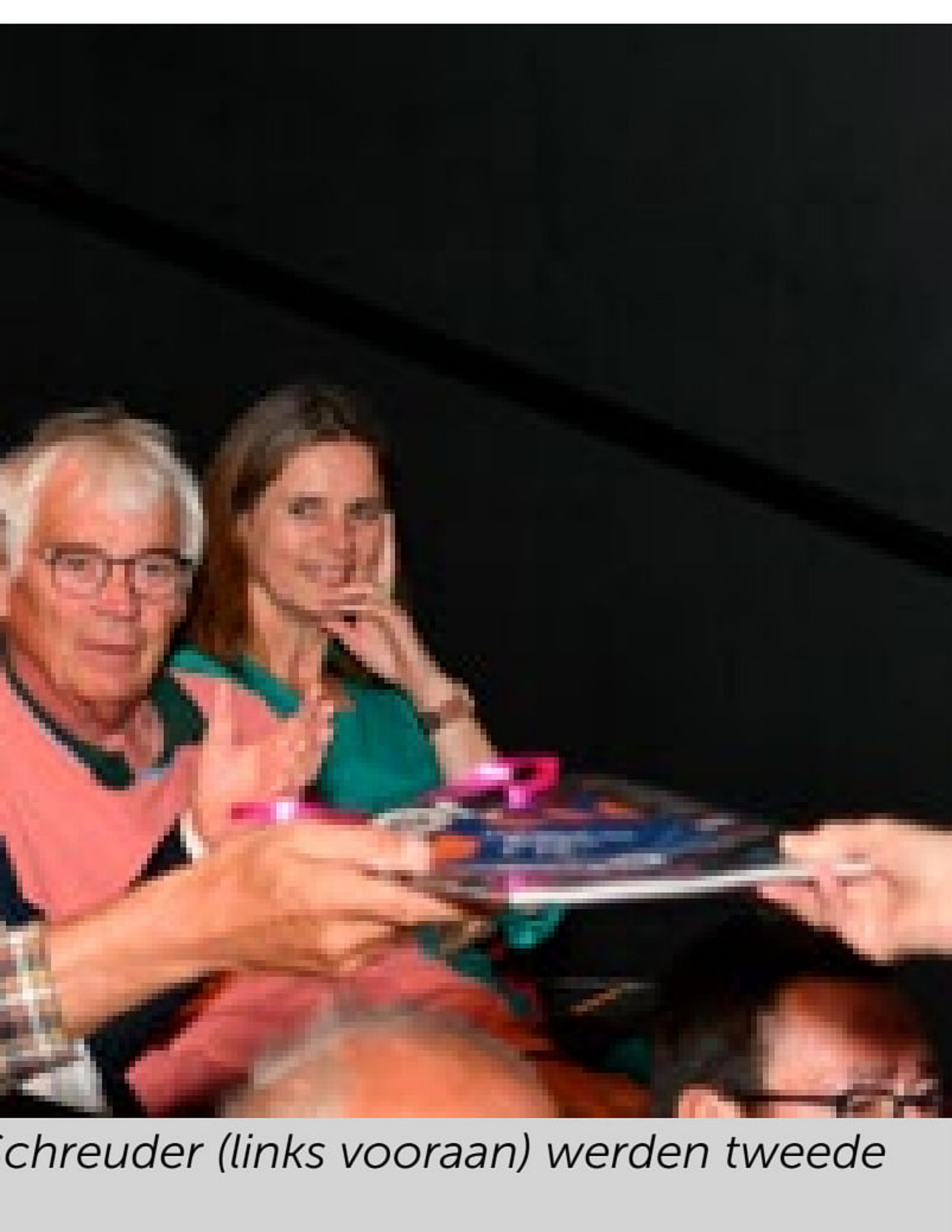
chreuder (links vooraan) werden tweede