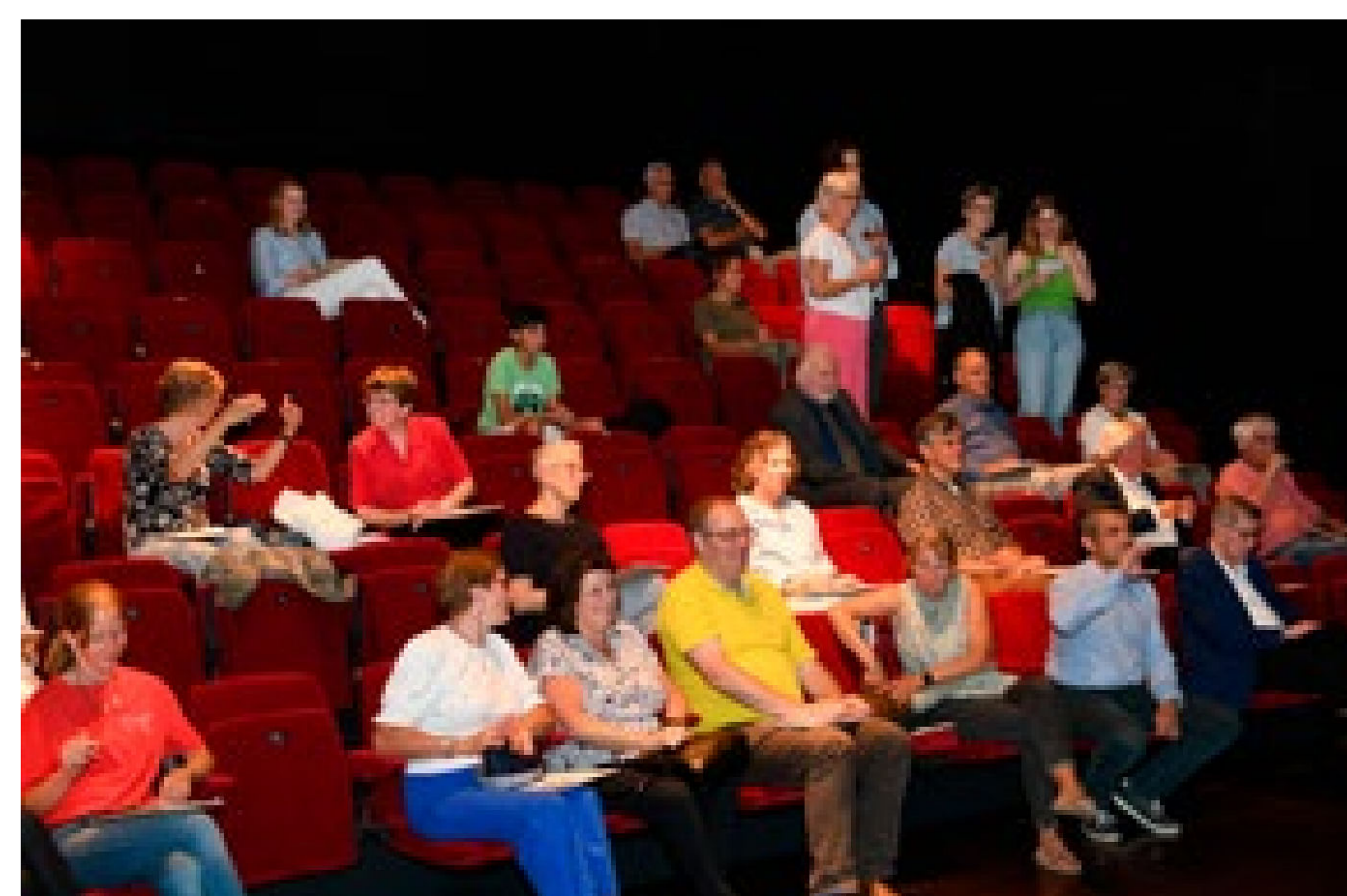
Voordat de prijzen werden uitgereikt, was er een loterij met veel prijzen.