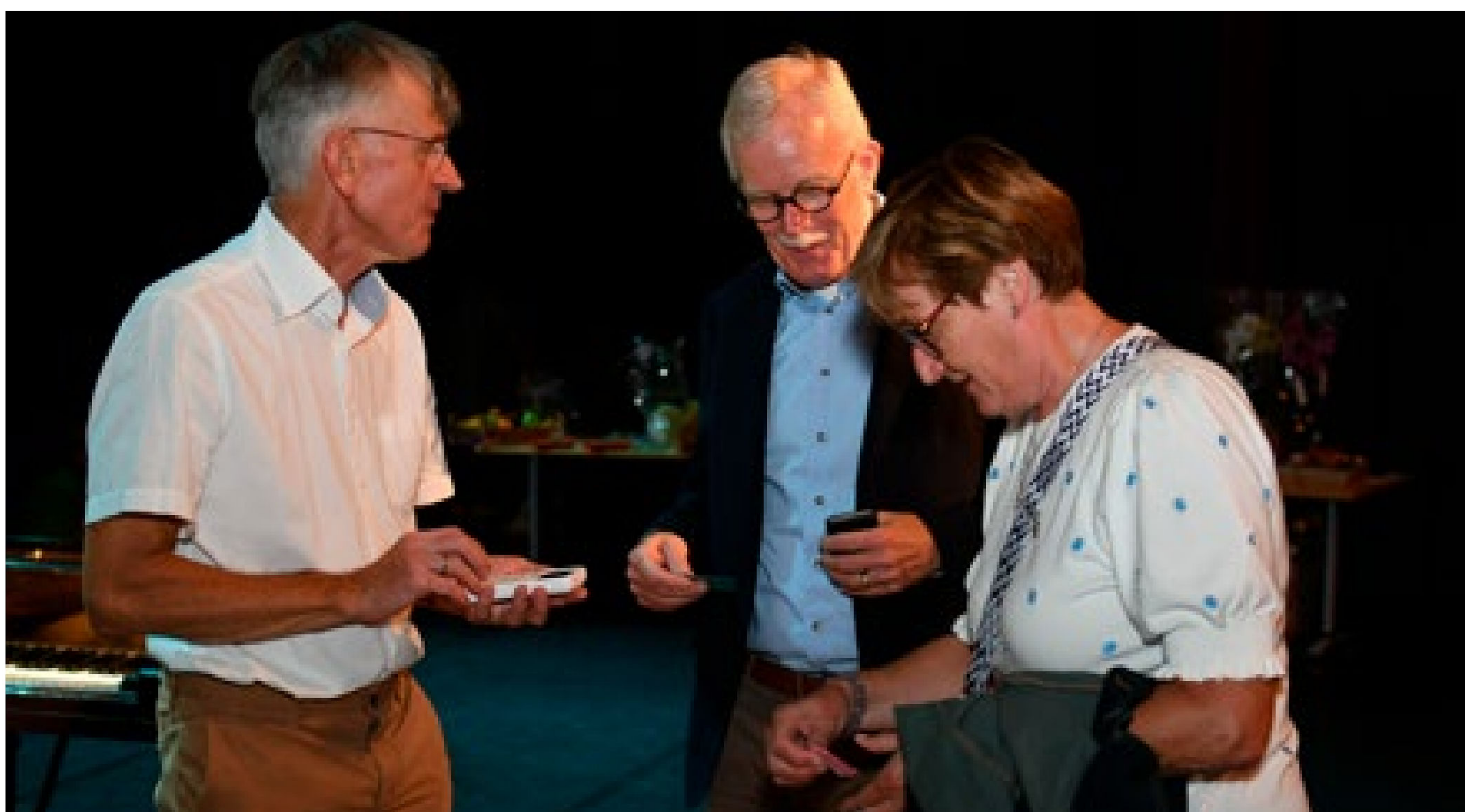
De verkoop van de loten bracht 700 euro op.