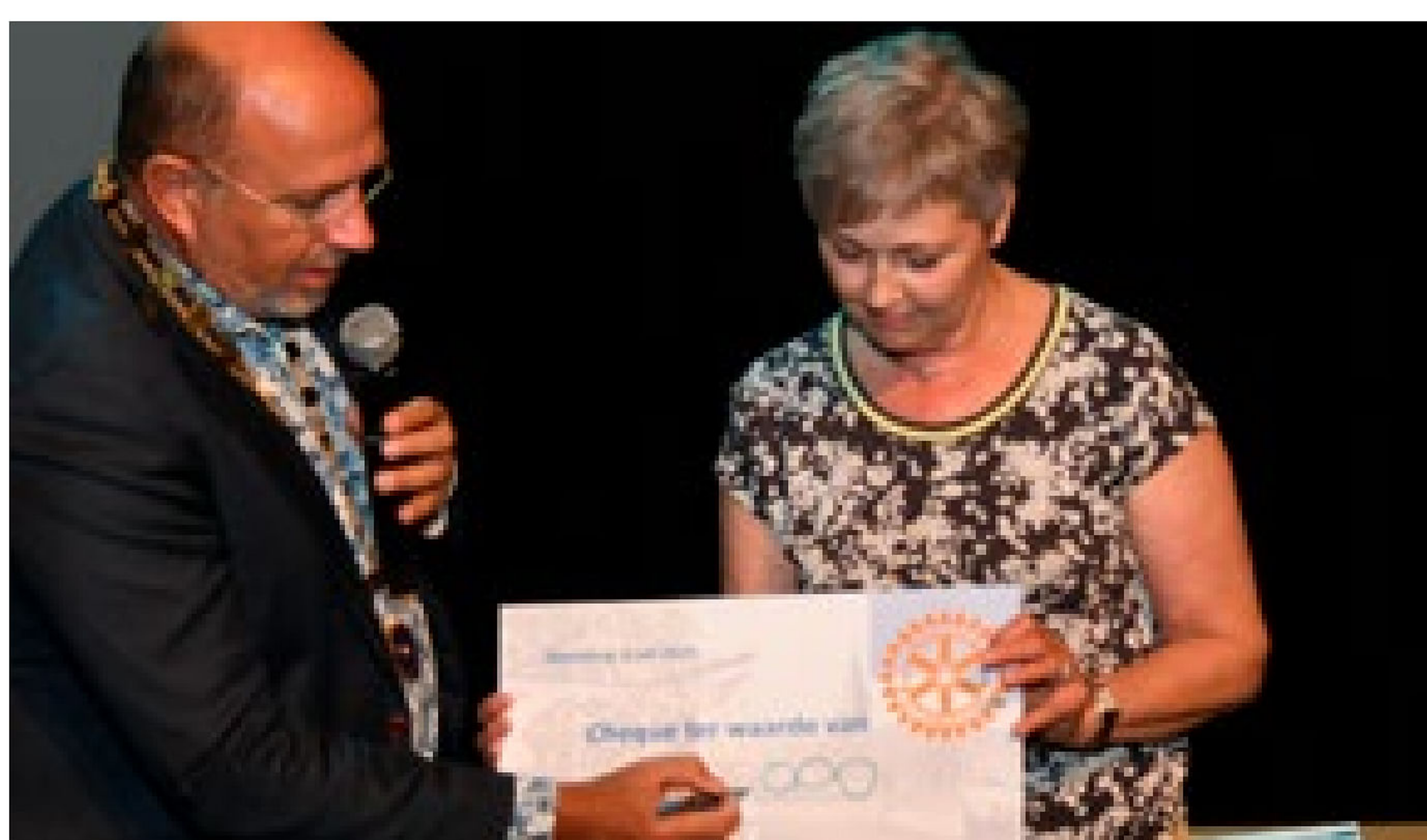
Een één met vier nullen levert het getal: 10.000 op.

sponsors, donateurs, CultuRA & Zo en allen die deze avond tot een succes hebben gemaakt heel hartelijk! Op naar de volgende editie? Houd daarvoor de website en de Facebookpagina van Rotary Club Pijnacker-Nootdorp en natuurlijk de Telstar/Eendracht in de gaten!