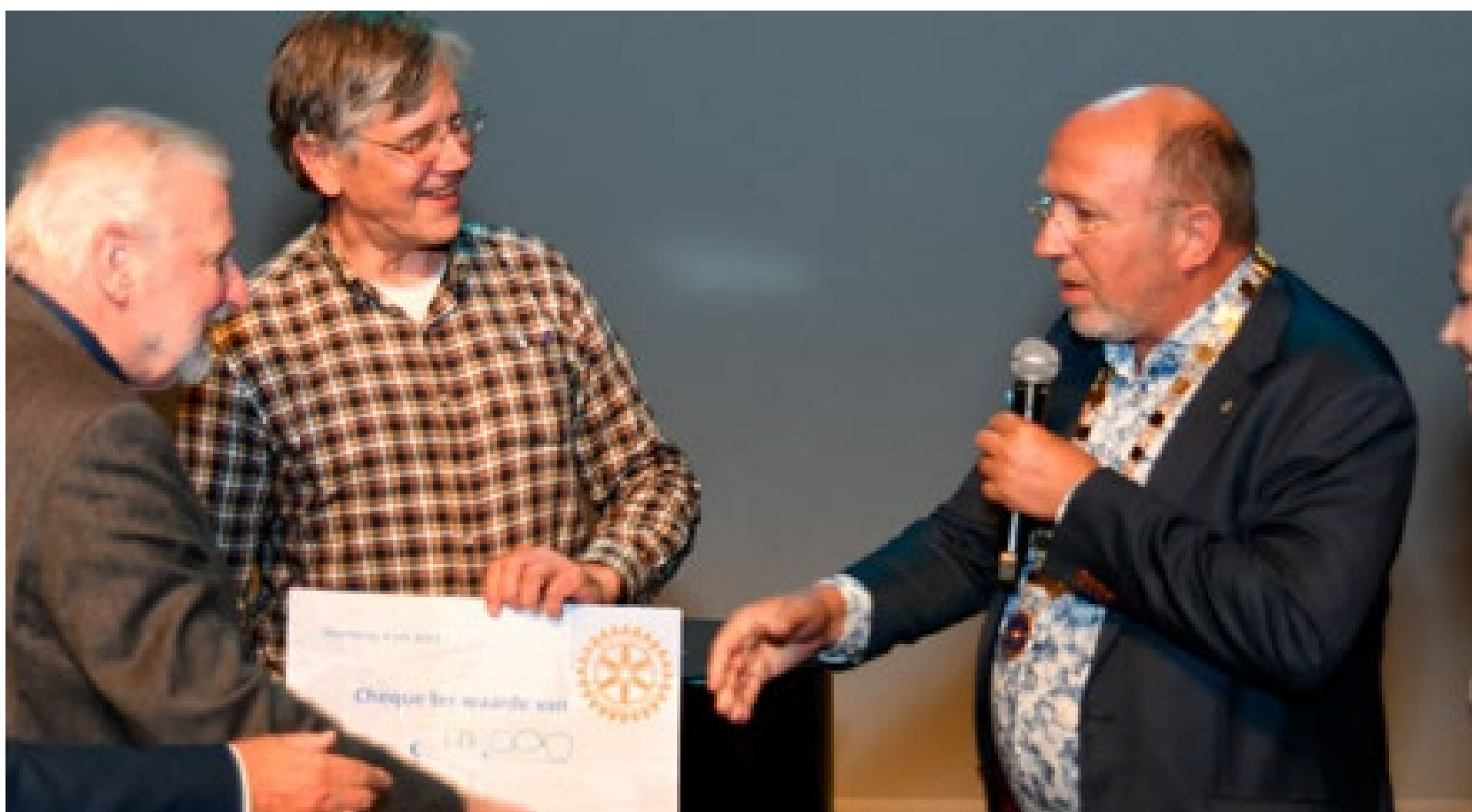
Een prachtige cheque voor Hospice Koningshove.